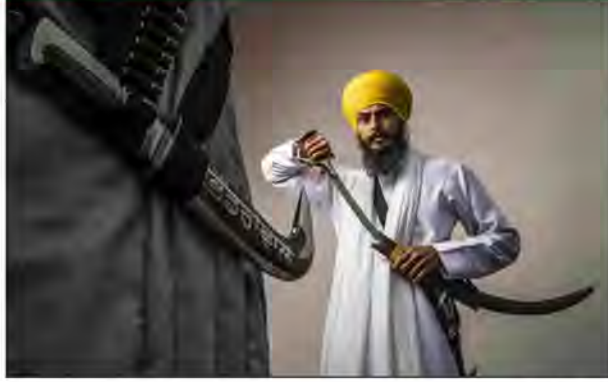
ਉਸ ਨਾਲ ਸੀ ਤੇ ਉਸ ਨੇ ਹਥਿਆਰਾਂ ਦਾ ਪ੍ਰਦਰਸ਼ਨ ਕੀਤਾ ਸੀ ਤੇ ਉਸ ਦੀ ਹਥਿਆਰਾਂ ਨਾਲ ਵਾਇਰਲ ਹੋਈ ਵੀਡੀਓ ਤੋਂ ਬਾਅਦ ਪੁਲਿਸ ਨੇ ਉਸ ਖ਼ਿਲਾਫ਼ ਇਹ ਮਾਮਲਾ ਦਰਜ ਕੀਤਾ ਸੀ ਕਿਉਂਕਿ ਉਸ ਨੇ ਪੁਲਿਸ ਅਧਿਕਾਰੀਆਂ ਦੇ ਹੁਕਮਾਂ ਦੀ ਉਲੰਘਣਾ ਕੀਤੀ ਸੀ ਤੇ ਉਸ ਸਮੇਂ

ਐਡਵੋਕੇਟ ਵਿਰਕ ਨੇ ਦੱਸਿਆ ਕਿ ਦਰਜ ਕੀਤੇ ਗਏ ਮੁਕੱਦਮੇ ਅਨੁਸਾਰ ਖ਼ਾਲਸਾ ਵਹੀਰ ਜਦੋਂ ਕੁੱਕੜ ਪਿੰਡ ਪਹੁੰਚੀ ਤੇ ਗੁਰ ਔਜਲਾ