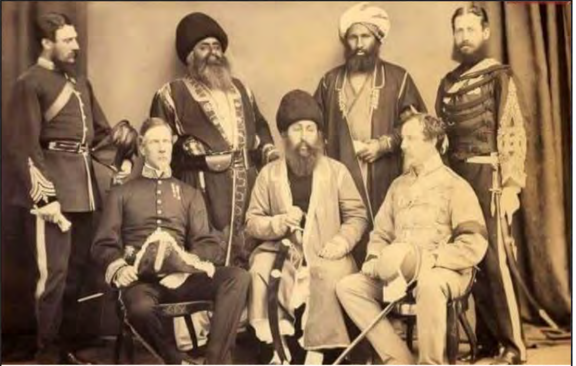
Maharaja Ranjit Singh won Lahore on 8th July 1799. This is actual photo taken on 25th October 1835 when India's Viceroy William Bentinck came to meet him at Lahore. He is seated on the left and Maharaja Ranjit Singh is in the Middle.