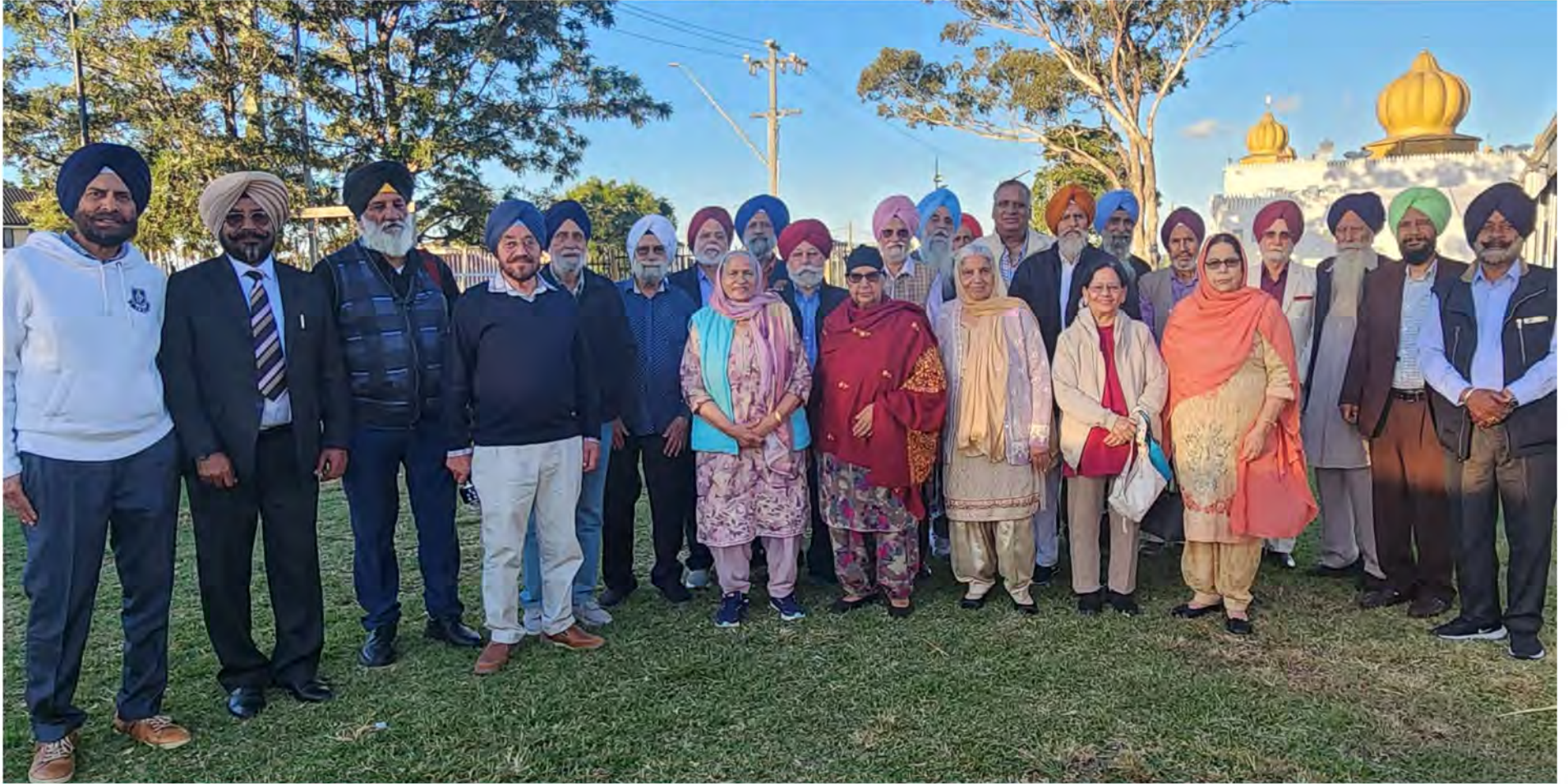
Senior citizens join Sahitak Darbar every month in Baba Buddha Hall of Glenwood Gurughar. This group photo covers all those who joined this Darbar in May. For full report please see page No. 4