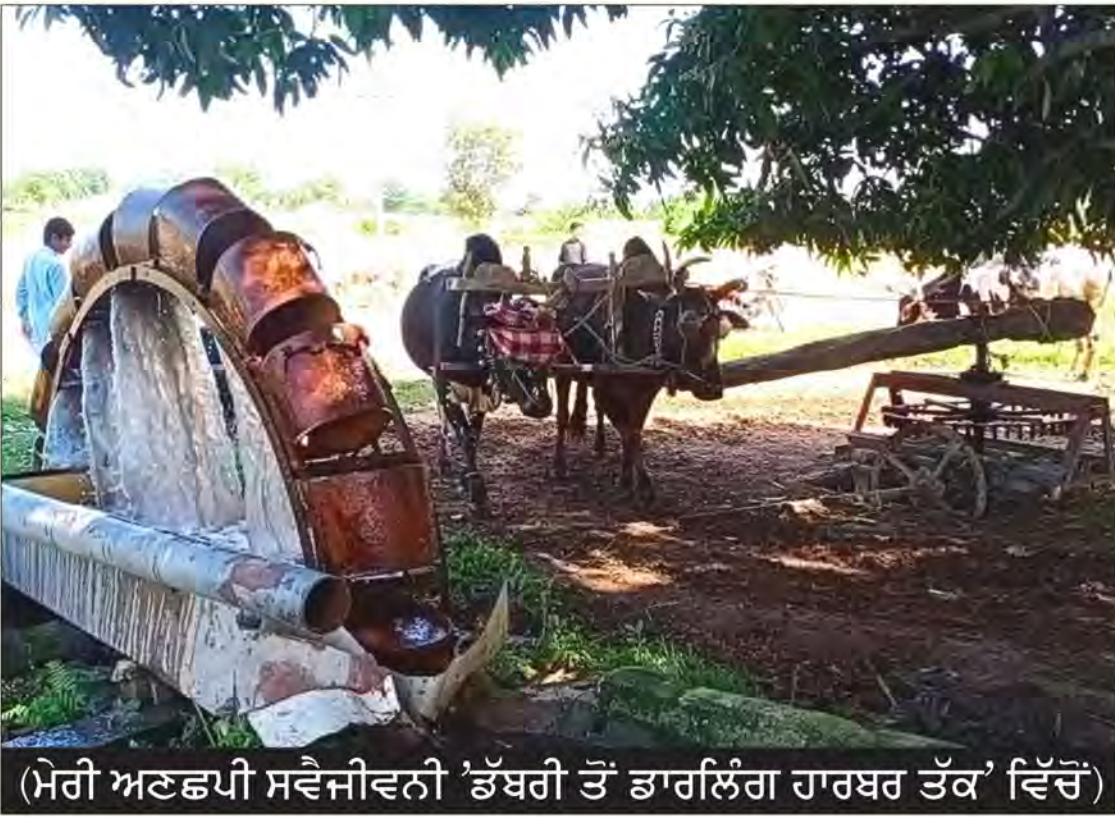
(ਮੇਰੀ ਅਣਛਪੀ ਸਵੈਜੀਵਨੀ 'ਡੱਬਰੀ ਤੋਂ ਡਾਰਲਿੰਗ ਹਾਰਬਰ ਤੱਕ' ਵਿੱਚੋਂ)

ਇਸ ਪ੍ਰਕਾਰ ਮੈਂ ਹੋਰ ਕਿੰਨੇ ਸਾਰੇ ਪੇਂਡੂ ਸ਼ਬਦਾਂ ਨੂੰ ਸ਼ਹਿਰੀ ਰੰਗਤ ਦੇ ਕੇ ਬੋਲਾਂ। ਮੇਰੀ ਮਾਂ ਮੇਰੇ ਵਿੱਚ ਇਹ ਫਰਕ ਦੇਖ ਕੇ ਮੁਸਕਰਾਈ ਜਾਵੇ, ਕਹੇ ਕੁੱਝ ਨਾ। ਥੋੜ੍ਹਾ ਜਿਹਾ ਇਹੋ ਕੁੱਝ ਮੇਰੇ ਨਾਲ ਮੇਰੇ ਵਿਆਹ ਤੋਂ ਬਾਅਦ ਵੀ ਹੋਇਆ ਸੀ। ਮੇਰੀ ਘਰਵਾਲੀ ਦੀ ਐਮ. ਏ. ਤੇ ਬੀ. ਐਡ. ਤੱਕ ਦੀ ਸਾਰੀ ਪੜ੍ਹਾਈ ਚੰਡੀਗੜ੍ਹ ਦੀ ਸੀ। ਵੈਸੇ ਉਹ ਪਿੱਛਿਓਂ ਲੁਧਿਆਣਾ ਨੇੜੇ ਇੱਕ ਪਿੰਡ ਦੀ ਹੈ। ਖਾਪ ਪਿੰਜੋਰ ਨੇੜੇ ਨੌਕਰੀ ਕਰਦਾ ਹੋਣ ਕਰਕੇ ਉਹ ਚੰਡੀਗੜ੍ਹ ਹੀ ਪੜ੍ਹੀ ਏ। ਜਦ ਮੇਰਾ ਵਿਆਹ ਹੋਇਆ ਤਾਂ ਉਹ ਦਾਜ ਵਿੱਚ ਕੁੱਝ ਅਜਿਹੀਆਂ ਚੀਜ਼ਾਂ ਲੈ ਆਈ ਜਿਨ੍ਹਾਂ ਦਾ ਨਾਮ ਮੈਂ ਪਹਿਲੀ ਵਾਰ ਸੁਣਿਆ ਸੀ। ਹੋਰ ਦੋ ਕੁ ਬਾਰੇ ਤਾਂ ਮੈਂ ਭੁੱਲ ਚੁੱਕਾ ਹਾਂ। ਹਾਂ ਇੱਕ ਚੀਜ਼ ਸੀ ਜਿਸਨੂੰ ਉਹ 'ਟੈਕੋਜ਼ੀ' ਕਹਿ ਕੇ ਬੋਲਦੀ ਸੀ। ਇਹ ਕੋਤਲੀ ਵਿੱਚ ਚਾਹ ਨੂੰ ਗਰਮ ਰੱਖਣ ਲਈ ਕੋਤਲੀ ਦੇ ਪਹਿਰਾਵੇ ਦੇ ਤੌਰ ਤੇ ਵਰਤਣ ਲਈ ਥੋੜ੍ਹੇ ਫੁੱਲਵੇਂ ਕੱਪੜੇ ਦੀ ਬਣੀ ਹੋਈ ਹੁੰਦੀ ਏ। ਕਈ ਵਾਰ ਇਸ ਤੇ ਖੂਬਸੂਰਤ ਕਢਾਈ ਵੀ ਕੀਤੀ ਗਈ ਹੁੰਦੀ ਏ। ਇਸ ਪ੍ਰਕਾਰ ਦੀਆਂ ਦੋ ਕੁ ਹੋਰ ਕਰੋਸ਼ੀਆ ਦੀਆਂ ਬਣਾਈਆਂ ਹੋਈਆਂ ਆਈਟਮਾਂ ਵੀ ਸਨ। ਕੁੱਝ ਪਹਿਰਾਵੇ (ਸਾੜੀ, ਮੈਕਸੀ ਆਦਿ) ਵੀ ਫੈਸ਼ਨਬਲ ਤੇ ਮਾਡਰਨ ਸਨ। ਘਰ ਵਿੱਚ ਦੋ ਸੱਭਿਆਚਾਰ ਇਕੱਠੇ ਹੋ ਗਏ, ਇੱਕ ਪੂਰਾ ਪੇਂਡੂ ਤੇ ਦੂਜਾ ਪੂਰਾ ਸ਼ਹਿਰੀ। ਮੈਂ ਸੋਚਾਂ ਕਿ ਇਹ ਦੋਵੇਂ ਭਿੜ ਨਾ ਜਾਣ। ਮੇਰੀ ਮਾਂ ਇੰਨੀ ਸਮਝਦਾਰ ਸੀ ਕਿ ਉਹ ਮੇਰੀ ਘਰਵਾਲੀ ਦੇ ਬਹੁਤੇ ਸ਼ਬਦ ਸੁਣਦੀ ਰਹਿੰਦੀ ਸੀ ਪਰ ਬੋਲਦੀ ਘੱਟ ਸੀ। ਜੇ ਬੋਲਦੀ ਤਾਂ ਉਹ ਸਹਿਮਤੀ ਤੇ ਪੁਸ਼ੱਸਾ ਦੇ ਸ਼ਬਦ ਹੀ ਬੋਲਦੀ ਸੀ। ਇਸੇ ਕਰਕੇ ਮੇਰੀ ਮਾਂ ਤੇ ਘਰਵਾਲੀ ਦਰਮਿਆਨ ਕਦੀ ਵੀ ਕੋਈ ਝਗੜਾ ਨਹੀਂ ਸੀ ਹੋਇਆ। ਮੇਰੀ ਘਰਵਾਲੀ ਨਿਰਸੰਦੇਹ ਅਗਾਂਹਵਧੂ ਅਤੇ ਆਧੁਨਿਕ (modern) ਵਾਲੀ ਸੀ ਤੇ ਮੇਰੀ ਮਾਂ ਪਰੰਪਰਾਵਾਦੀ ਤੇ ਪੱਛੜੀ ਹੁੰਦੀ ਹੋਈ ਵੀ ਆਧੁਨਿਕ ਅਤੇ ਉਸਾਰੂ