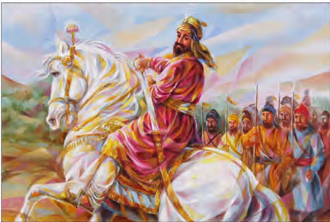
ਜਨਮ ਦਿਹਾੜਾ ਵਿਸ਼ੇਸ਼