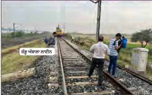
ਸੰਭੂ ਆਬਾਲਾ ਲਾਈਨ