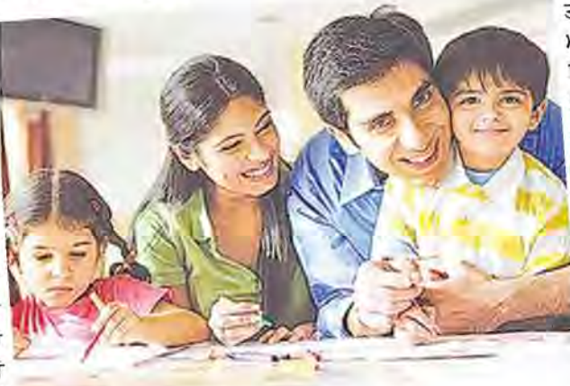
ਬਹੁਤ ਵਾਰ ਮਾਤਾ-ਪਿਤਾ ਇਹ

ਮਾਤਾ-ਪਿਤਾ ਨੂੰ ਵੀ ਚਾਹੀਦਾ ਹੈ ਕਿ ਉਹ ਬੱਚਿਆਂ ਦੇ ਸਾਹਮਣੇ ਸਹੀ ਢੰਗ ਨਾਲ ਪੇਸ਼ ਆਉਣ।