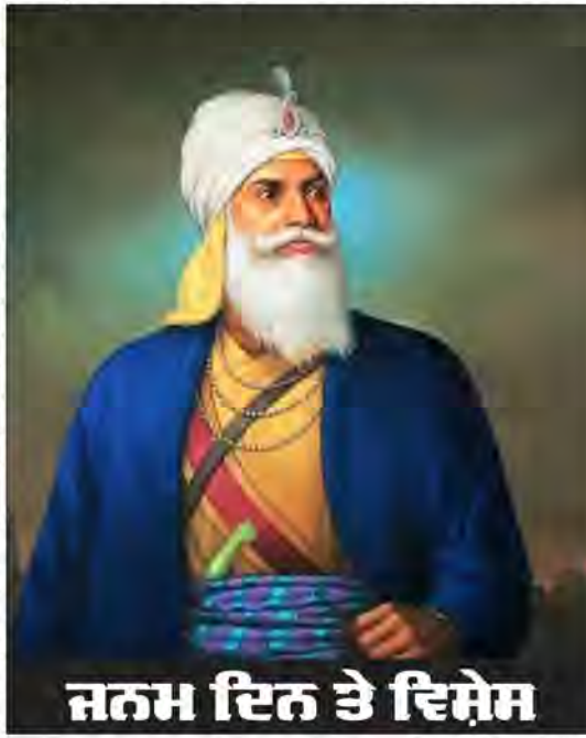
ਜਨਮ ਦਿਨ ਤੇ ਵਿਸ਼ੇਸ਼