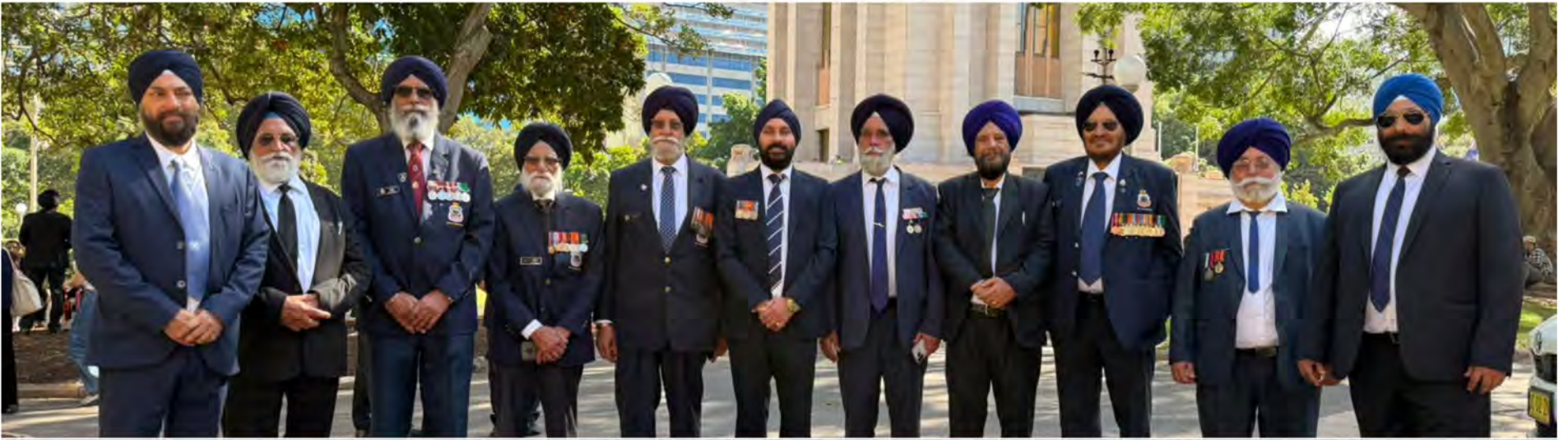
The ANZAC Ceremony in Sydney is a solemn and respectful event which was held on 25th April 2026. It honoured the soldiers of the Australian and New Zealand Army Corps who fought at Gallipoli Campaign during World War I. The main ceremony took place at Martin Place Cenotaph. Thousands of people gathered to clap the Parade. Our Sikh Community including Defence Officers marched in a disciplined manner.